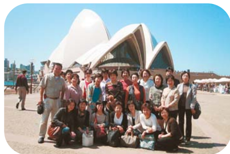
オペラハウスにて記念撮影

域の専門医師又は病院施設の専門医師に紹介してくれます。専門医は、地域の中に自らの診療施設を持ちながら、契約している病院で自分の専門性が必要とされた時に、病院に出向きその力を発揮します。「かかりつけ医」の選択は、自由にできますが、専門医師の診療は基本的に紹介状なしには受けられません。日本でも、医療機関の機能分化と医療連携の重要性が話題になっているところですが、オーストラリアにおいてはその体制が出来ているのです。私たちの受療行動が、地域医療の存続や医療の質の向上に大きな力と成ることを強く感じた研修でした。